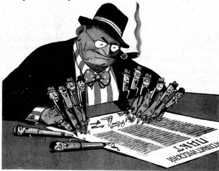
Торжественное подписание Атлантического пакта