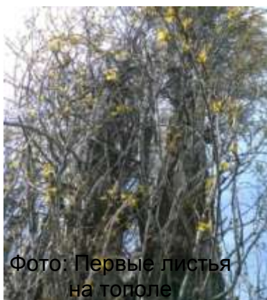
Фото: Первые листья на тополе пирамидальном

25 марта на тополе стали заметны почки. Они немного вытянутые и заострённые, в длину 3 см., имеют коричневый цвет, липкие. Постепенно от почки отшелушиваются чешуйки. Через две недели из почек стали разворачиваться листья. Лист на ощупь гладкий, имеет глянцевый блеск, по форме круглый, с вытянутым кончиком. Из-начально, листья имеют зеленовато-коричневую окраску, но позже становятся полностью зелёными.