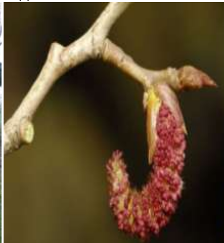
Фото Изучение мужского соцветия тополя пирамидального

Тополь очень неприхотлив и способен выдерживать повышенную загазованность воздуха, перерабатывая углекислый газ в кислород, что является одним из его полезнейших свойств. По выработке кислорода тополь превосходит даже сосну и ель. Одно дерево выделяет столько кислорода, сколько семь елей, четыре сосны или три липы. Фитонциды тополя губительны для многих вредных для человека микробов. Является пыльценосом. Пчелы собирают пыльцу и используют её в изготовлении прополиса. Снижает шум, очищает воздух от пыли и газа. За вегетативный сезон один тополь освобождает атмосферу от 20 до 30 килограммов пыли или сажи. В качестве лекарства используются кора, семена и