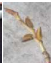
Фото: Тополь пирамидальный весной. Фото: Почки пирамидального тополя. Фото Отшелушивающиеся чешуйки почек тополя