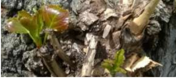
Фото :Молодые листья тополя.