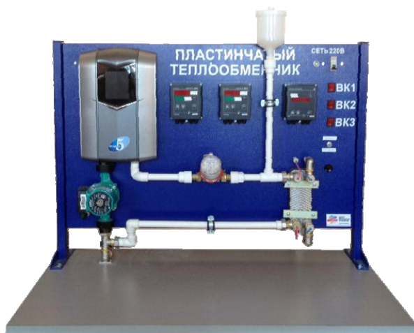
Рис. 3. Фотография лабораторной установки

1 – сливной кран горячего теплоносителя, 2 – циркуляционный насос подачи горячего теплоносителя, 3 – водонагреватель со ступенчатым управлением нагревом, 4 – счетчик расхода горячего теплоносителя с импульсным выходом, 5 – датчик температуры горячего теплоносителя на входе в теплообменник Т1, 6 – пластинчатый теплообменник, 7 – датчик температуры горячего теплоносителя, 7 – датчик температуры холодного теплоносителя Т3, 8 – насос подачи холодного теплоносителя противотоком, 9 – насос подачи холодного теплоносителя прямотоком, 10 – резервуар холодного теплоносителя, 11 – датчик температуры горячего теплоносителя на входе теплообменника Т2, 12 – датчик температуры холодного теплоносителя Т4.